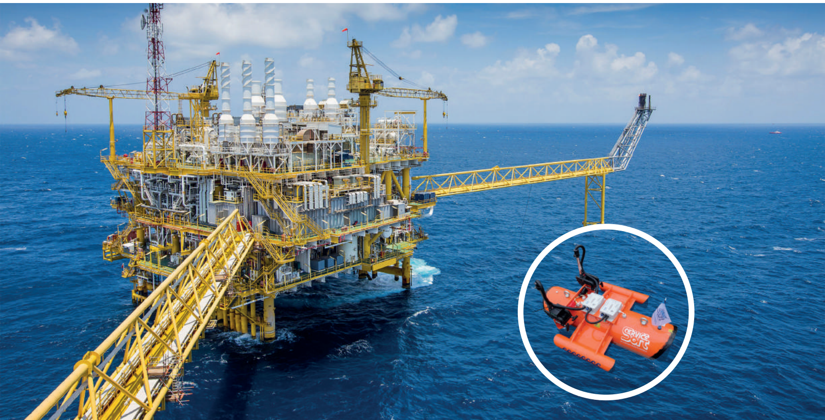
Схема работы системы спутникового мониторинга акватории